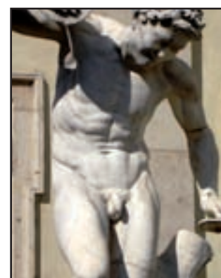
...i w Łazienkach.

Reszta miasta też nie jest wolna od penisów. Dokładnym spisem nieprzyzwoitych rycin, malunków i rzeźb dysponuje stołeczny konserwator zabytków. Liczymy, Drogowskazię Moralności Polskiej, że pokażesz jedyną słuszną ścieżkę prowadzącą do prawdziwej cnoty.