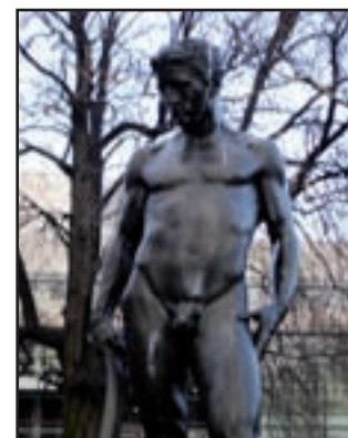
Penis w Parku Ujazdowskim...